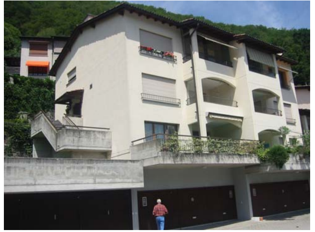
Ansicht Haus / Eingang Wohnung