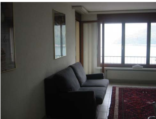
Sitzecke (kann als Doppelbett benutzt werden)